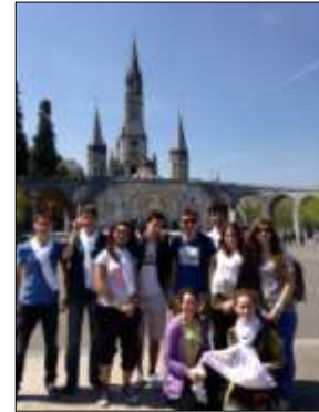
FRAT LOURDES 2014 POUR LES LYCEENS

RETRAITE /PROFESSION DE FOI / PREMIERE COMMUNION AU COLLEGE