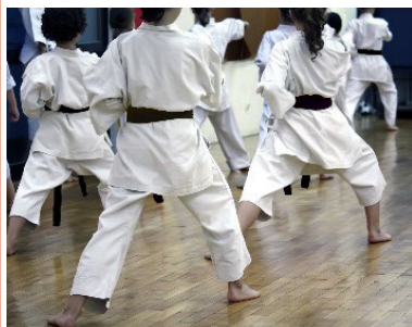
Ref 2020/2021 FA – Document non contractuel – crédits photos : Fotolia

Assurer le développement durable de nos clients passe aussi par la promotion d'une activité économique responsable. Convaincu du pouvoir de chacun d'apporter des solutions, Fides Assurances s'engage dans le dispositif Création de Valeur Partagée en soutenant des initiatives solidaires ou responsables.