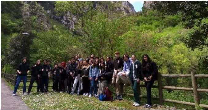
Visite des Grottes de Frasassi.