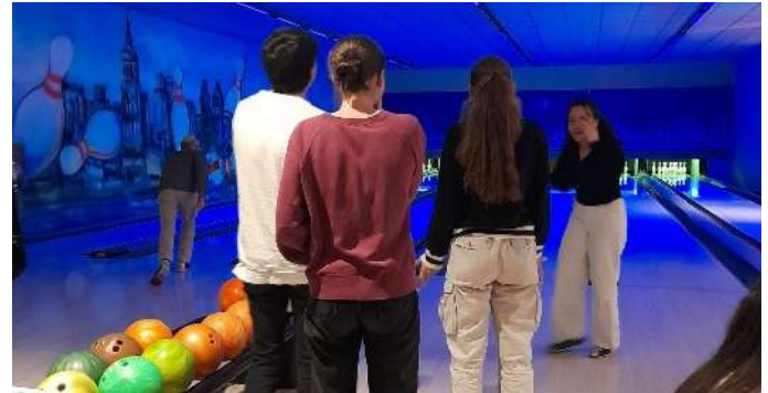
Soirée d'adieu au Bowling de Senigallia !