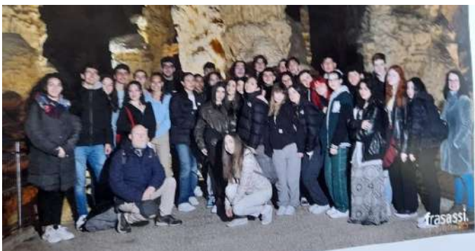
...avec Abbaye de San Vittore alle Chiuse, au musée spéléo-paléontologique et archéologique. Musée du papier et de la filigrane.

Tous nos camarades s'accordent pour dire à quel point notre séjour a été une expérience enrichissante qu'on souhaiterait renouveler !