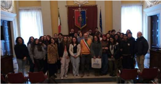
Accueil à la mairie de Senigallia.