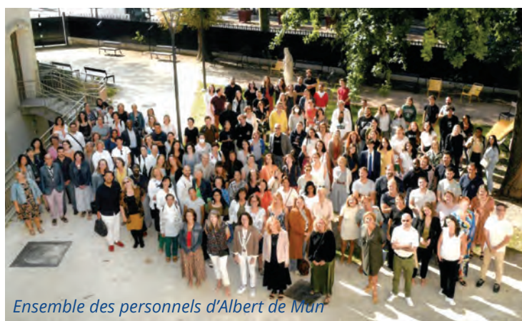
Ensemble des personnels d'Albert de Mun