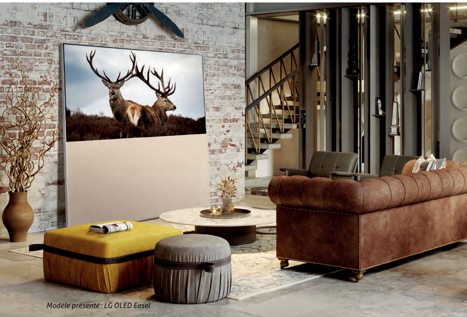
Modèle présenté : LG OLED Easel